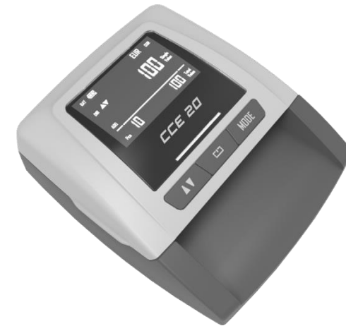
CCE 20 – Tester bankoviek

V prípade akýchkoľvek problémov s vašim CCE 20, ktoré nie je možné vyriešiť pomocou tohto manuálu, sa obráťte najskôr na svojho predajcu. Uschovajte si svoju faktúru o nákupe ako doklad o záruke. Štítko s výrobným číslom nesmie byť odstránené ani poškodené alebo zmenené iným spôsobom inak zariadenie stratí záruku. Ak chcete vrátiť zariadenie na opravu alebo servis je potrebné zariadenie poslať spolu s kópiou faktúry a reklamačný popisom o prejavenej závade.